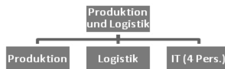
Abbildung 1: Ergänzung Organigramm der Schneeweiss, SOLL-Zustand

Bereits während der SWOT-Analyse wurde die IT an beiden Standorten inventarisiert. Auf der folgenden Seite finden Sie den Auszug der Ist-Soll-Analyse, welche die IT betrifft.